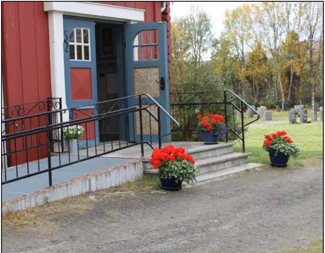
Dalen kyrkje pynta til hausttakkefest