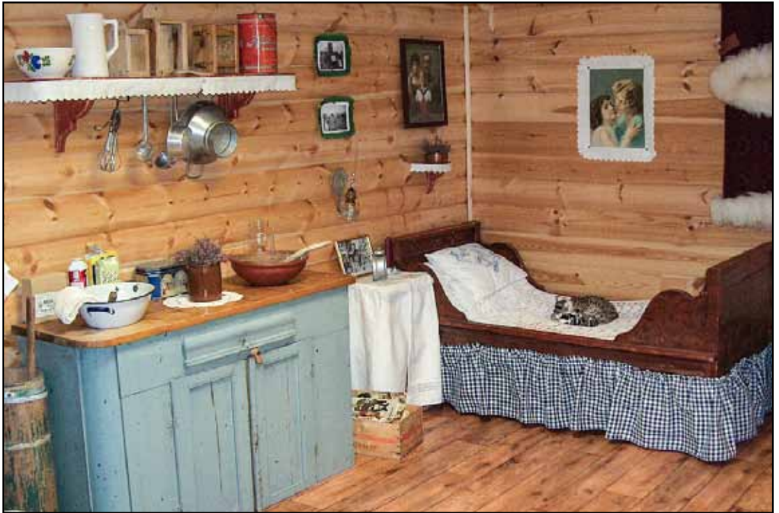
Seterstue: Interiør gjenskapt med gammelt møblement på Folldal Bo- og servicesenter.

blant mine fineste sommerminner. Vi klev og klatra og badet i iskaldt fjellvann. Ingenting var farlig den gang og vi fikk lov til å utfolde oss bare vi var hjemme i tide til måltidene. Det eneste vi måtte passe oss for var hoggorm. Vi så mye orm, men ingen ble bitt. Den var ofte nære innpå setra i det høye gresset eller den solte seg på steinhellene. Men det var en slags fredelig sameksistens som hersket. Dessuten gikk vi alltid i gummistøvler uansett varme.