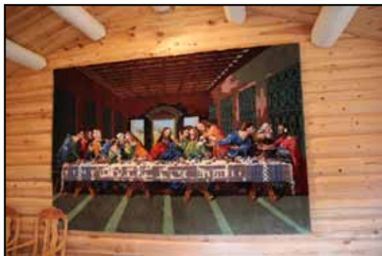
Håndverkskunst. Teppet i bårerommet har nattverden som motiv.