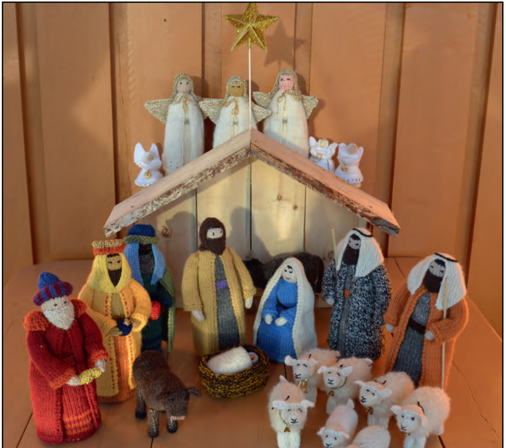
Julekrybbe med strikkede figurer, produsert i Grimsbu