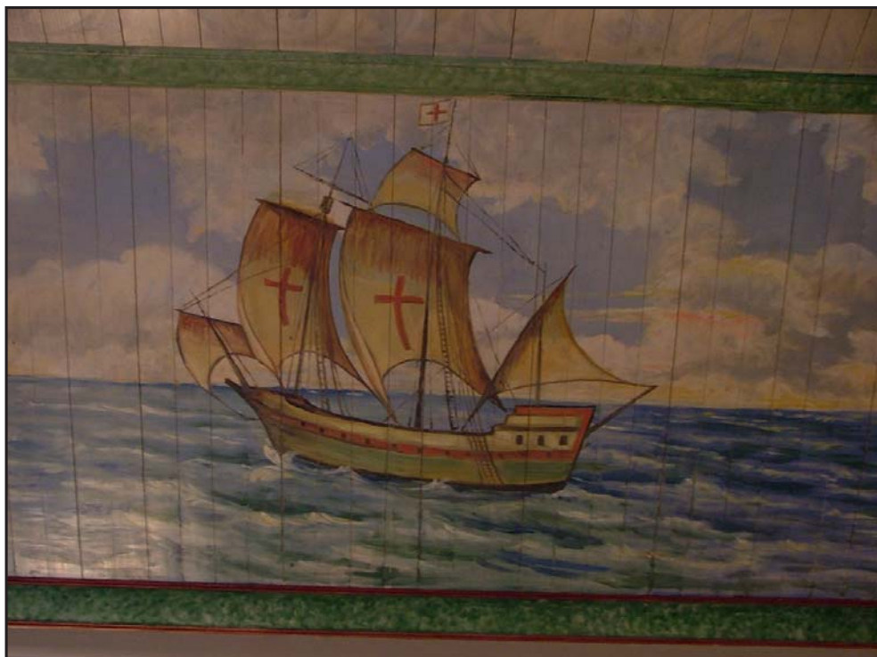
Fra taket i Dalen kyrkje

27. mars Påskedag Joh 20,1-10 11.00 Folldal krk. Ryen. Høytidsgudstjeneste. Nattverd. Offer: Menighetsarbeidet 19.30 Dalen krk. Ryen. Høytidsgudstjeneste. Nattverd. Offer: Normisjon