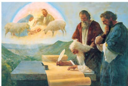
Profeten forutsier Jesu fødsel (Harry Anderson, IRI/ ids.org)

Kva heitte så profeten som skal ha kome med desse spådommane? I nyare bibelutgåver er første bokstaven i namnet J, medan namnet hans tidlegare vart skriven med E som forbokstav. Før du eventuelt ser etter under Småplukk lenger ut i bladet for å finne svaret, kan vi ta med ein liten kuriositet. Profeten blei kalla til si gjerning i samband med eit syn han hadde. I synet såg han Gud med ei kappe så stor at kanten på kappa fylte heile templet, og røysta han høyrde, fekk boltane i tempelportane til å riste.