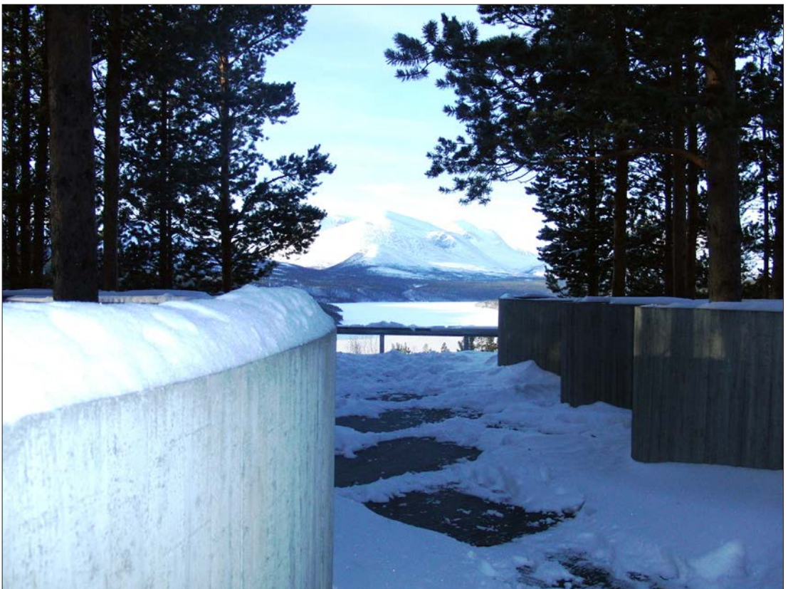
Vinter i blått: Utsyn mot Rondane fra Sohlbergs plass