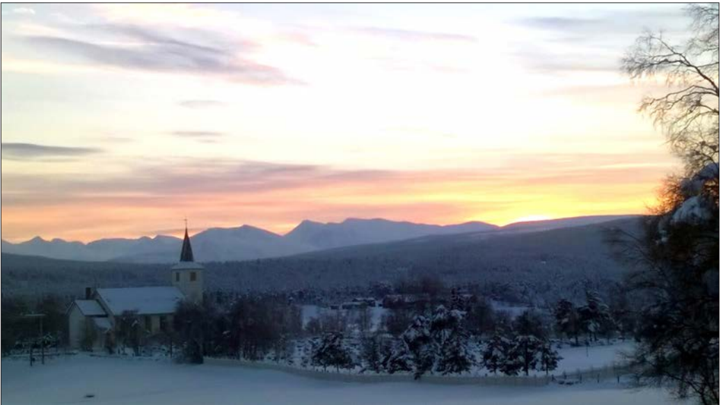
Vinterlys over Folldal kirke