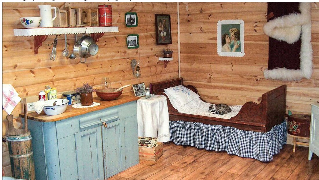
Seterstua ved Follidal Bo- og Servicesenter (arkivfoto).

For noen dager siden var jeg en tur innom Follidal alders- og sjukehjem og måtte selvfølgelig gå innom den nostalgiske og fine seterstua der. Det faller slik ro over en når man kan sitte der og la tankene gå samtidig som øynene hviler på gamle ting som var en del av min barndom. Den gamle separatorens bildene med rammer av hvitt papir, det broderte pyntehåndkleet, og ikke minst senga med hekleteppe på. Mens jeg satt litt på sengekanten og strøk hånda over den naturtro katta med sine unger som ligger der, la jeg merke til at skinnene på denne katta var blitt veldig slitt av utallige hender som har strøket over den. Her har nok mange av de eldre latt tankene gå tilbake til barndom og dyreliv på setra og kanskje på dyr de har hatt et nært forhold til.