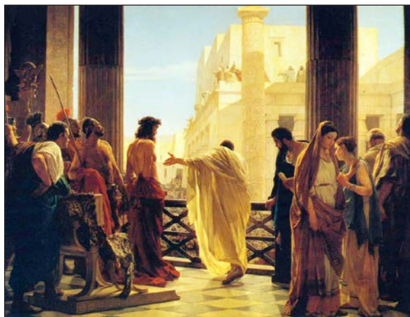
Ecce homo («Se det mennesket!»). A. Ciseris berømte maleri (1871) av Pilatus og Jesus foran folkemengden.