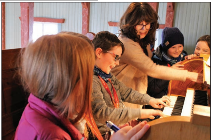
Tårnagenter: Fra årets tårnagenthelg i Folldal kirke første helga i april.