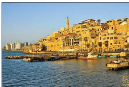
Historisk by: Jaffa.

Så ble Tabita syk og døde. I påvente av begravelsen ble hun stelt og lagt på et rom ovenpå. Imens hadde menigheten i byen fått høre at Peter oppholdt seg i nabobyen Lod. De sendte da to menn av sted for å be ham komme med en eneste gang. Da Peter kom til huset der Tabita lå, hadde enkene i byen samlet seg omkring den døde. Hadde Tabita vært med og forsørget disse enkene? De første kristne menighetene hadde nemlig et særskilt økonomisk ansvar for enker som stod alene uten familie. Tabita kan ha vært en viktig del av dette nettverket.