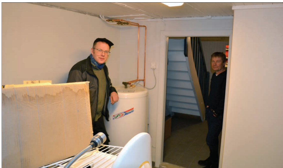
Lagerplass: Kjelleren blir etter opprydding og oppussing gode og romslige lagerrom.

Med dette er en altså ferdig oppe. Men også kjelleren blir tatt. Der er det revet ned litt skillevegger og rydda ut forskjellig rot, malt vegger og lagt fliser på gulvet, og det skal opp en del reoler. Dermed skal dette bli praktiske og gode lagerrom for mye forskjellig, fra utstyr for trosopplæringa til ymse ting ellers som må stå frostfritt.