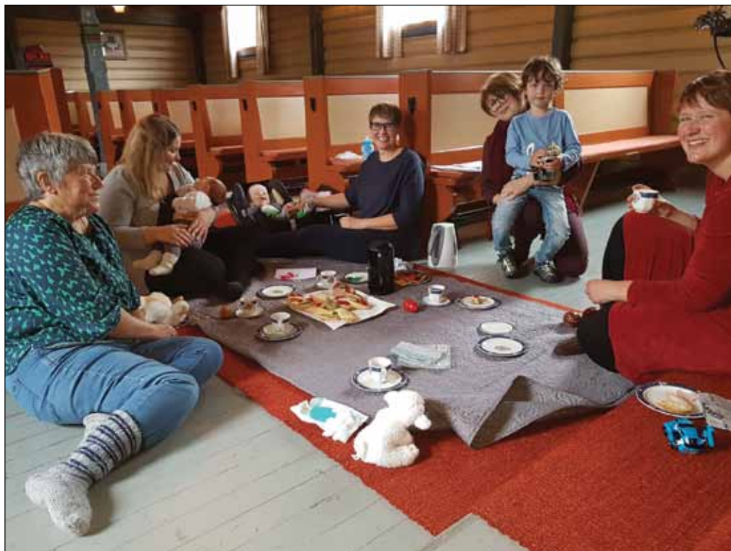
Babysang i Dalen kyrkje.