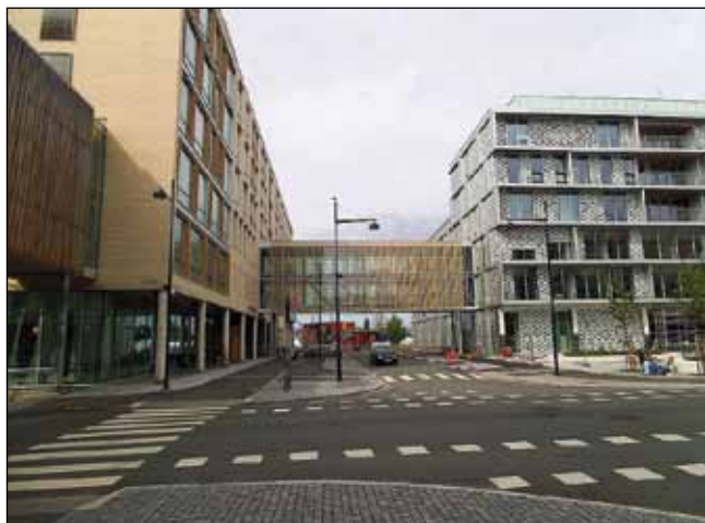
St. Olavs Hospital: Noen av nybyggene ved Olav Kyrres plass.