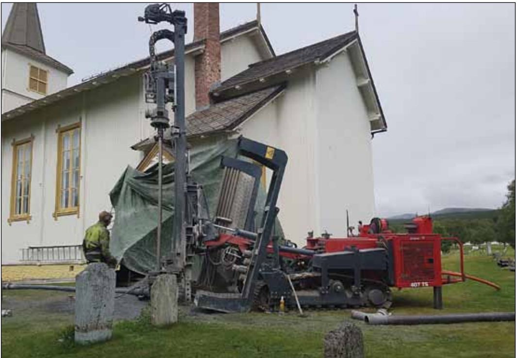
Nytt varmeanlegg: Fra høstens store prosjekt med boring etter bergvarme til Folldal kirke. Mer stoff kommer i neste nummer!