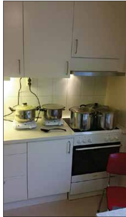
Fårikål på kok: Middagen er snart klar.

Og i en tid med økende ensomhet og sosiale utfordringer, kan det vel ikke gjøres på en bedre måte, enn å samles rundt et godt måltid mat. Det å dele et måltid, er i de fleste kulturer en gest som signaliserer hjertelighet og omtanke, samhørighet, vennskap og ærbødighet på et språk som vel ikke kan misforstås. Mat er ikke bare næring, men like mye en mulighet for å bygge relasjoner.