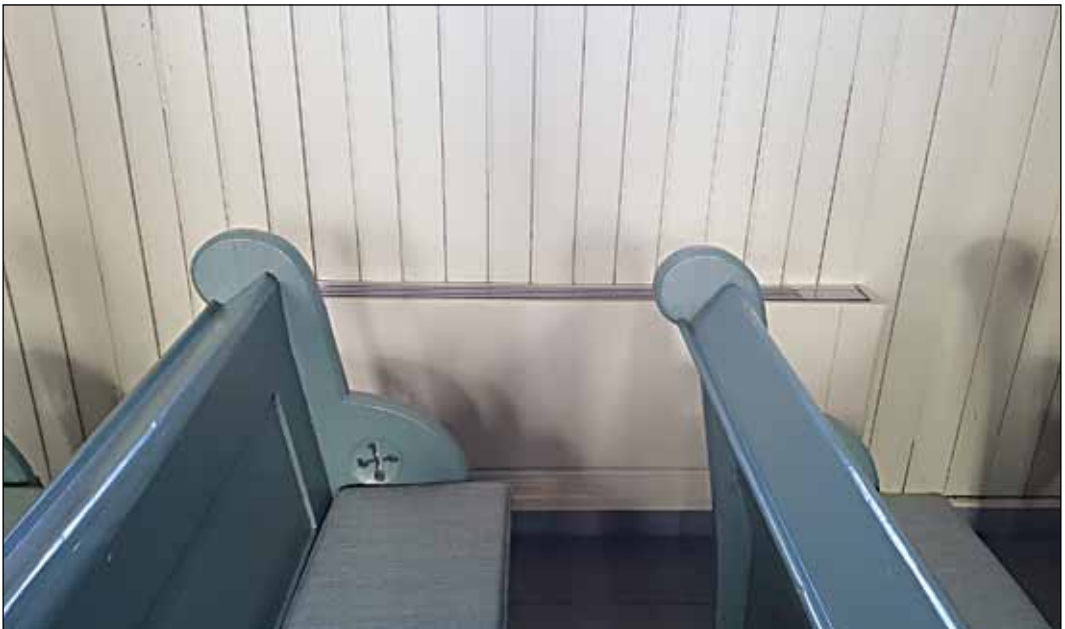
Nye radiatorer (viftekonvektorer) i Folldal kirke: Fargen og utformingen glir pent inn i det øvrige interiøret.

I kirkestua ble det montert luft-til-luftvarmepumpe. Denne pumpa er beregnet for å takle de utfordringene vi har vinterstid her i Folldal. Den er levert med appstyring, og kan styres fra mobiltelefon. Her også vil kir-