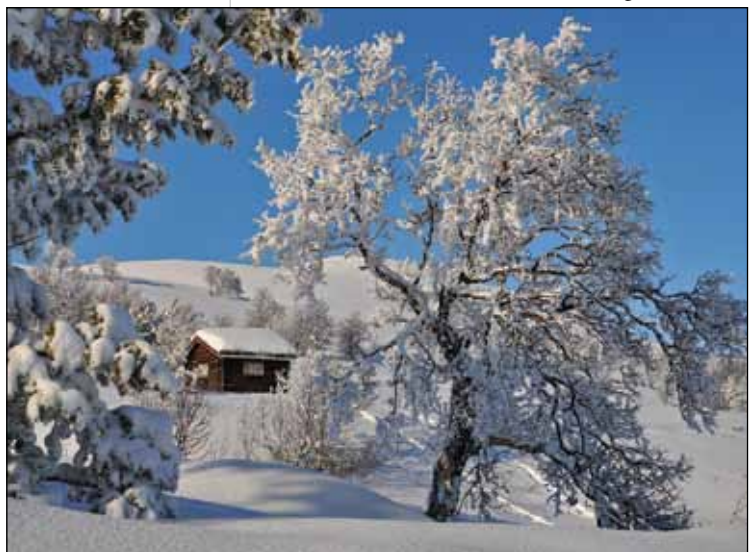
Ved Jensasætra.

21. juni 3. søn i treenighetstiden Luk 14,15-24 11.00 Egnund kpl. Ryen. Høymesse med nattverd. Offer til Tron ungd.senter.