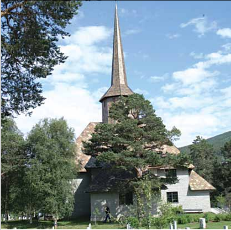
Dombås kyrkje.

Det gjør inntrykk når vi hører om eller ser tv-bilder av ei kirke som brenner. Vi føler med. Iallfall gjør jeg det. Enda sterkere kjenner det når det kommer så nært som nå, da morgennyhetene meldte at det brant i Dombås-kyrkja.