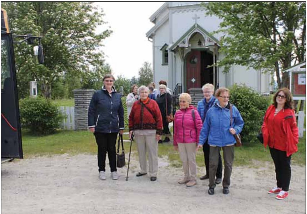
Tur til Vingelen: Fra diakonituren til Vingelen sommeren 2014.

De 12 siste årene har menigheten arrangert en busstur i løpet av sommeren. Etter en vurdering av diakonitvalget er det bestemt at turen dette året avlyses på grunn av smittefaren.