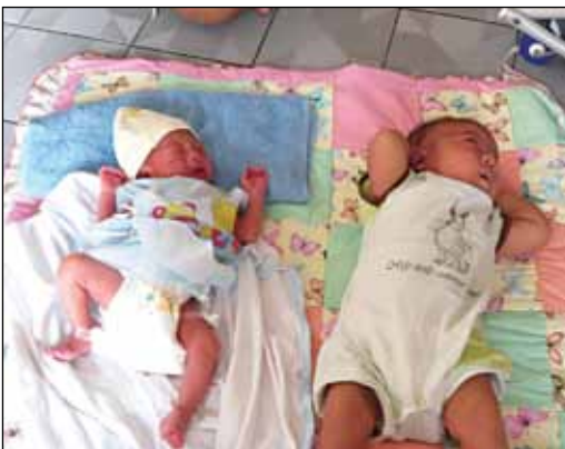
Be om deres beskyttelse: Babyer på Nådehjemmet i Bangkok.

Helseministeren i Thailand kom med en uheldig kommentar en dag, han ble så sint på noen utlendinger som ikke tok imot gra-