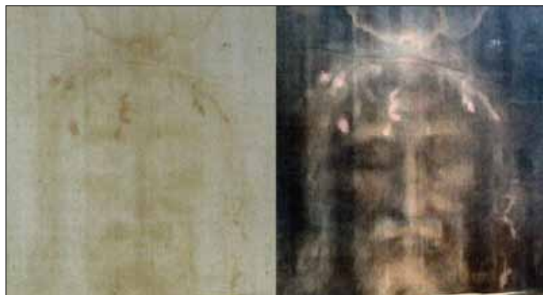
Avtrykk av mannskropp: Det berømte likkledet i Torino viser avtrykk av en korsfestet mann.

Likkledet i Torino inneholder altså et bilde (negativ) som viser en mannskropp med merker og sår som kan stemme med Bibe-