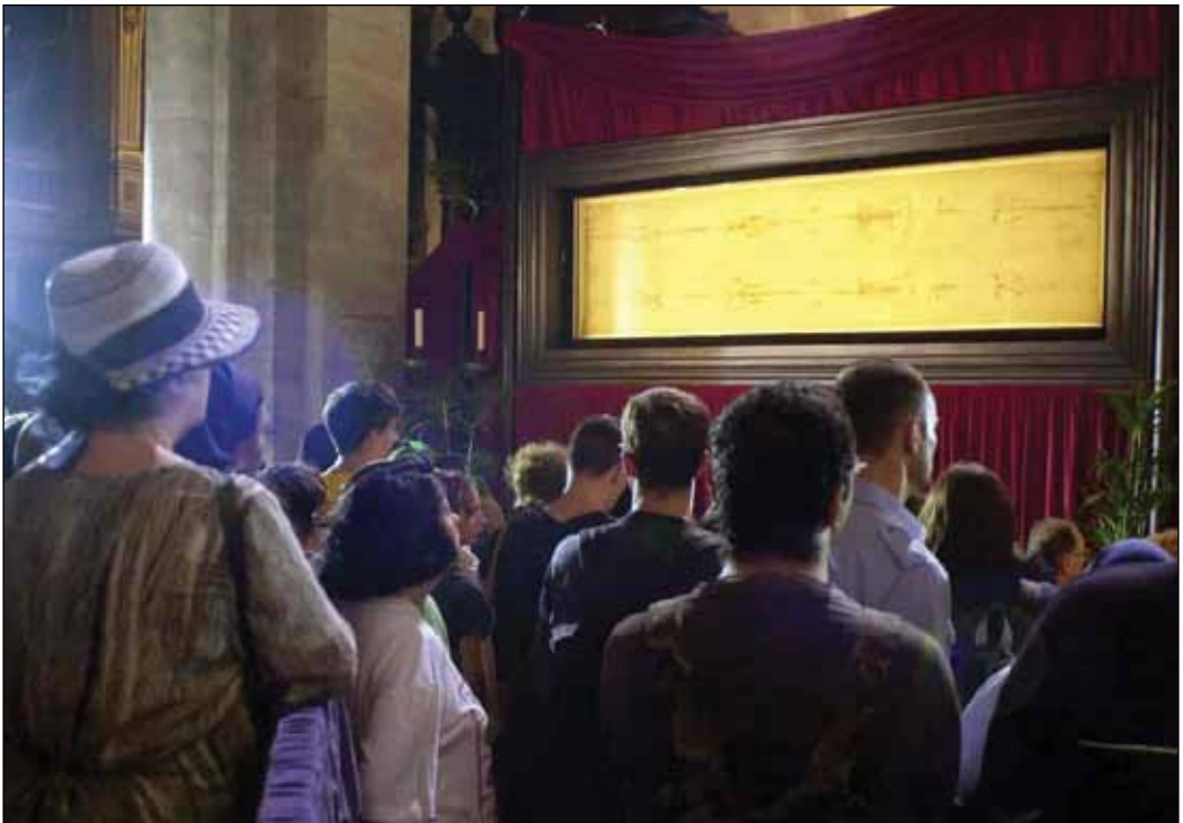
Vist offentlig: Likkledet vises sjelden fram offentlig. Her fra visningen i 2010.

Likkledet måler 436 x 110 cm, og man har