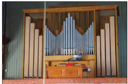
Dagens orgel: Orgelet fra 1969 er nedslitt etter bare drøyt 50 års bruk.

Fellesrådet gikk inn for et nybygd mekanisk pipeorgel i Folldal kirke. Rådet vurderte at dette vil gi de beste løsningene både musikalsk, visuelt og økonomisk gjennom hele orgelets levetid. Restaurering av dagens orgel vil inneha stor grad av økonomisk usikkerhet, vil ikke kunne ivareta en estetisk tilpasning til kirkerommet, vil gi en blanding av nytt og gammelt, og vil ha usikkerhet omkring levetid framover. Digitalt orgel ble også vurdert, men Fellesrådet utelukket