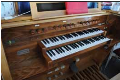
Orgelspillebord: Tusenvis av salmer er formidlet herfra siden 1969.

Løsningen som tidligere har vært drøftet, der også restaurering av det gamle Claus Jensen-orgelet som kororgel i Folldal kirke er med, er foreløpig lagt på is. Dette fordi det er stor usikkerhet omkring muligheten for å få plassert dette orgelet i kirka (Belg-løsning, plassmuligheter fremst i kirkeskipet, benk-/stolløsninger mm). Orgelet er oppbevart i Folldal kirke.