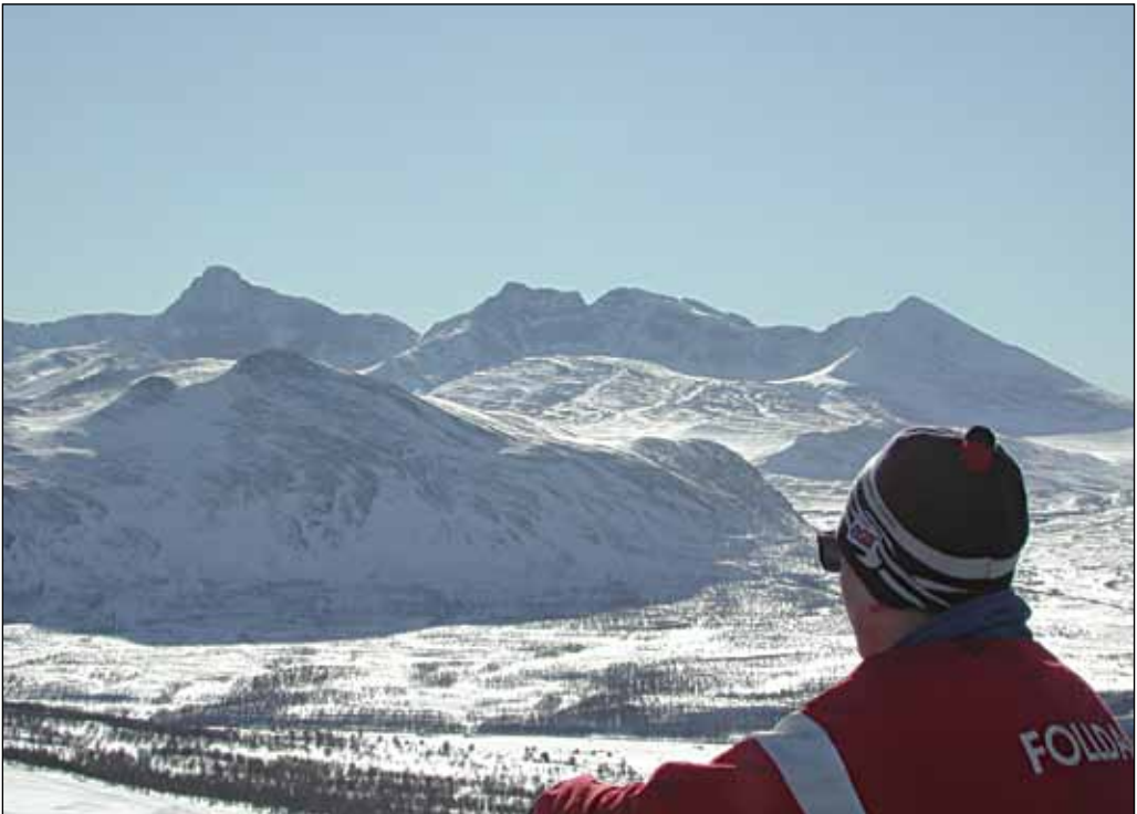
Utsikt mot Rondane fra Streitkampen