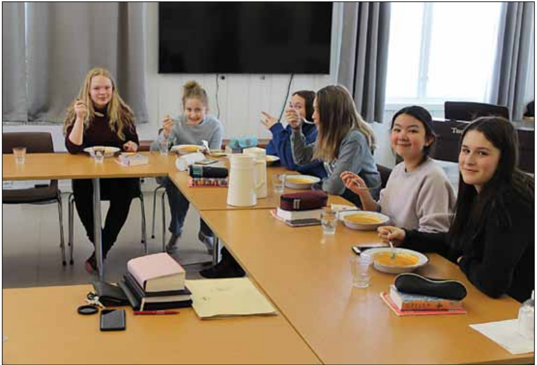
Konfirmantsamling: I andre halvdel av januar kom vi i gang igjen med konfirmantundervisningen etter jul. Samlingene er annenhver torsdag i kirkestua rett etter skoletid, og starter med et lite måltid.