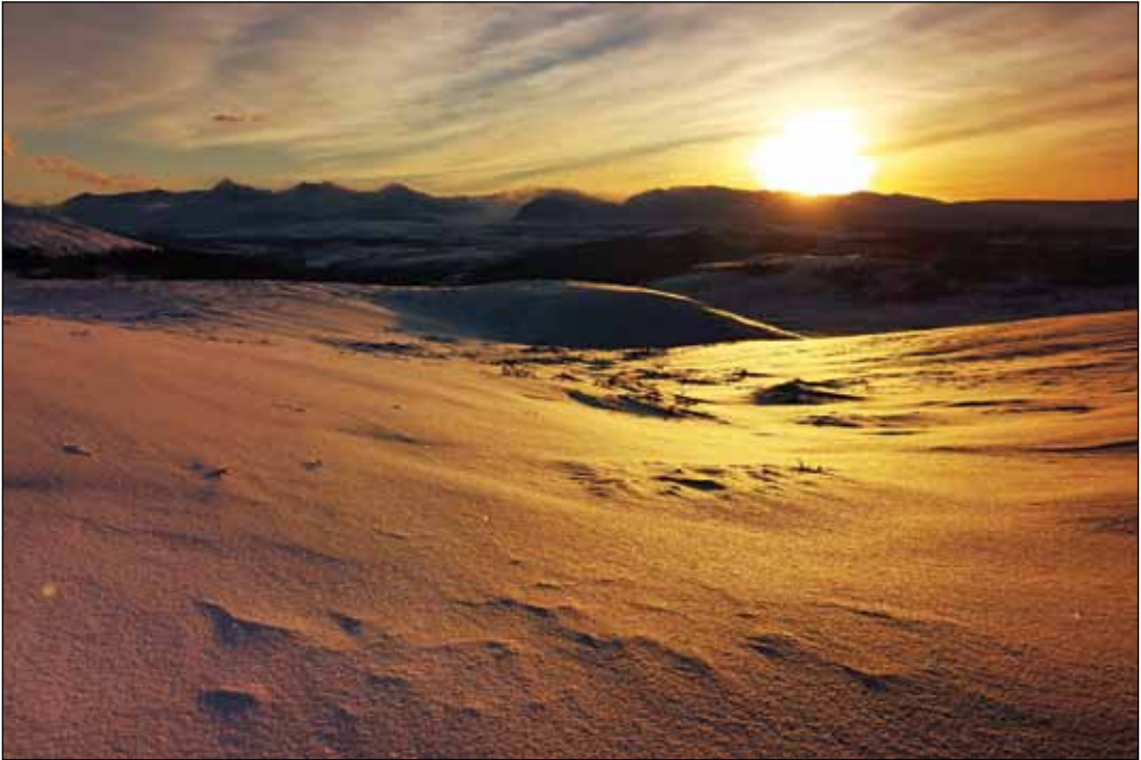
Rondane, sett fra Lonadalen.