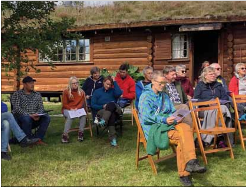
Framfor seterhuset: Utsnitt av forsamlinga som deltok på sjølve messa.

godt vær skapte ei fin ramme for dagen. Produsentlaget hadde òg ordna med god seterkost.