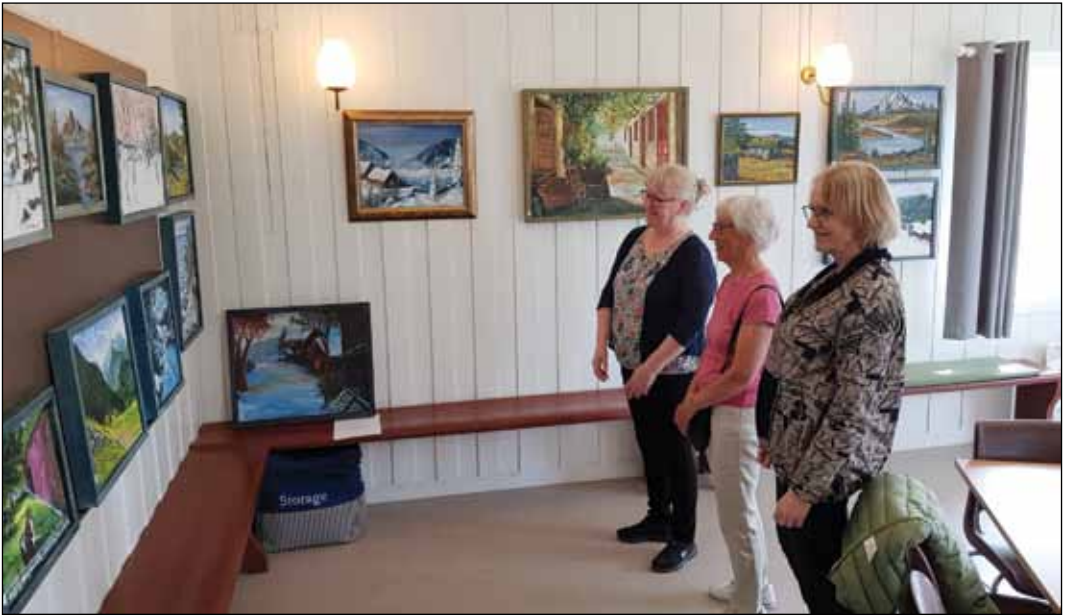
Utstilling: Tre publikummere gleder seg over fine bilder.