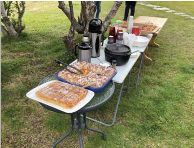
Matbord: Mykje godt, både varmt og kaldt, å forsyne seg med!