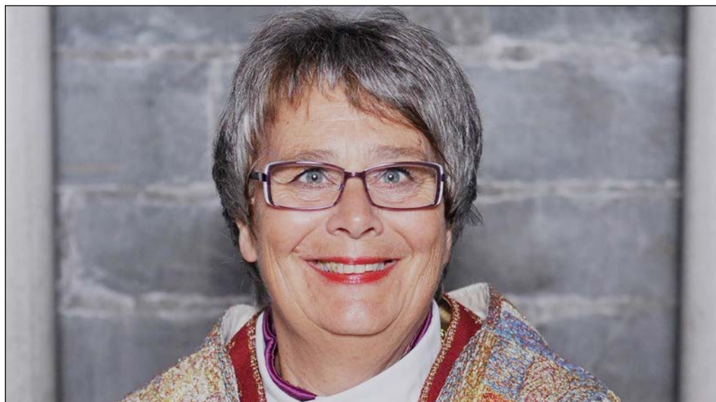
Biskop Solveig Fiske.