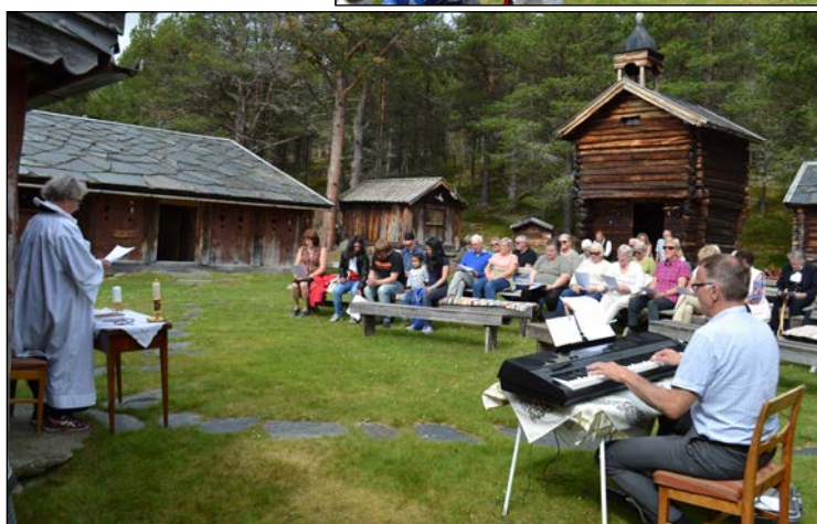
Liv på bygdetunet: Fra messa og arrangementet ellers på Uppigard Streitlien 24. juli.