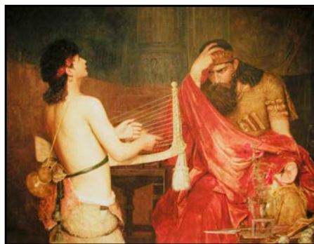
David spiller på harpe for Saul (Ernst Josephson 1878).

Første Samuels bok 18,7 gjengir et ordtak: «Saul slo tusener, men David har slått titusener». David fikk rykte på seg som en som overgikk Saul i det meste, også som kriger. Dette må ha skapt sjalusi på flere plan hos Saul i de siste årene av sin regjeringstid. Saul endte sitt liv ved at han begikk selvmord, hardt presset i kamp med filistrene. Etter å ha sett sine tre sønner bli drept av bueskyttere, styrtet han seg mot sitt eget sverd på slagmarken. Dette skal ha skjedd på Gilboa-fjellet i det nordlige Israel rundt år 1000 f.Kr.