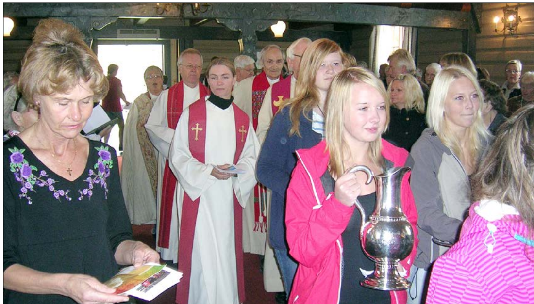
Førrige bispebesøk: Fra prosesjonen i Dalen ved kirkejubileet høsten 2010.