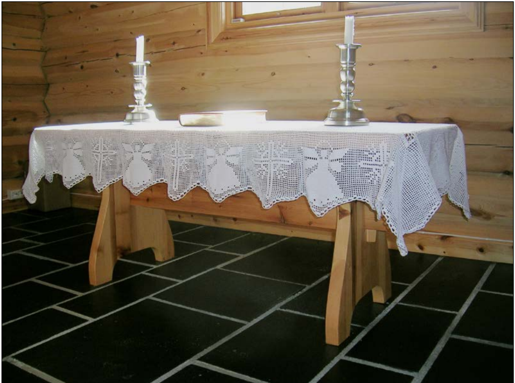
Frå bårerommet ved Dalen kyrkje