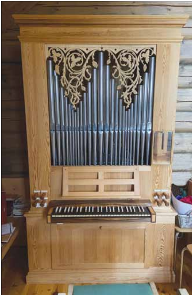
Fra Egnund kapell