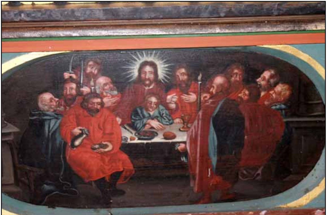
Det siste måltid. Fra altertavla i Folldal kirke (1676).