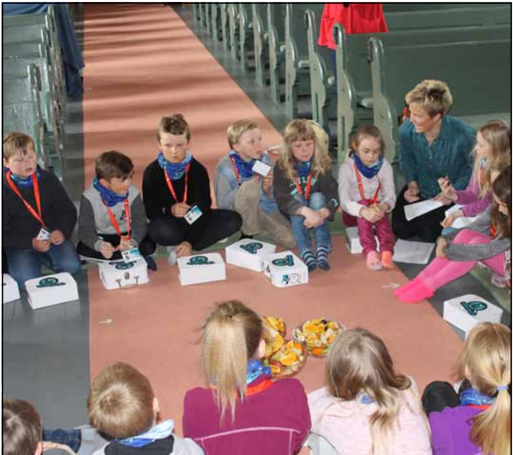
Tårnagenter klare til aksjon i Folldal kirke.