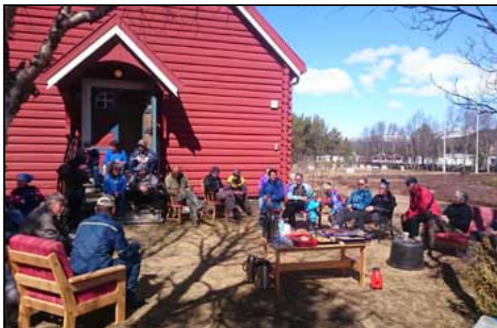
Vårpuss på Dalen kyrkjegard og ved Dalen kyrkje. Ei veke før 17. mai var det dugnad ute og inne ved Dalen kyrkje. Ein god dugnadsgjeng ordna med lauvraking, glas puss og elles førefallande oppgåver etter vinteren.