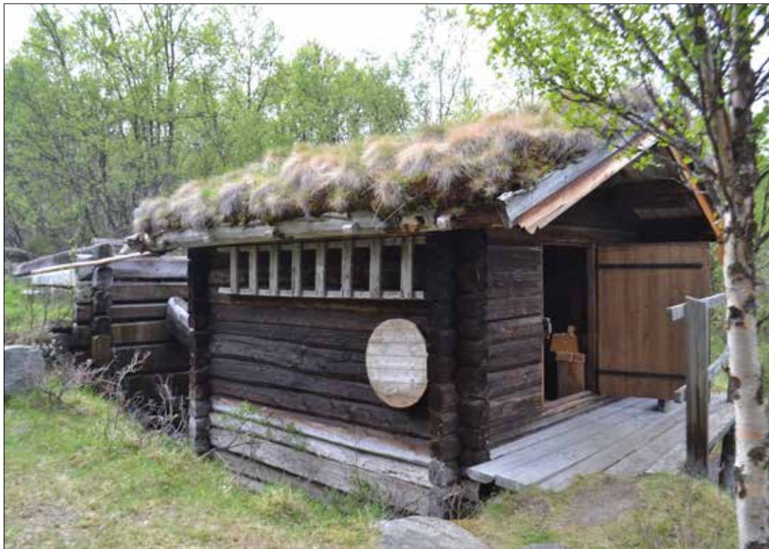
Kvenna i Kvita: Borkhuskvenna i Kvita, med dammen like bak