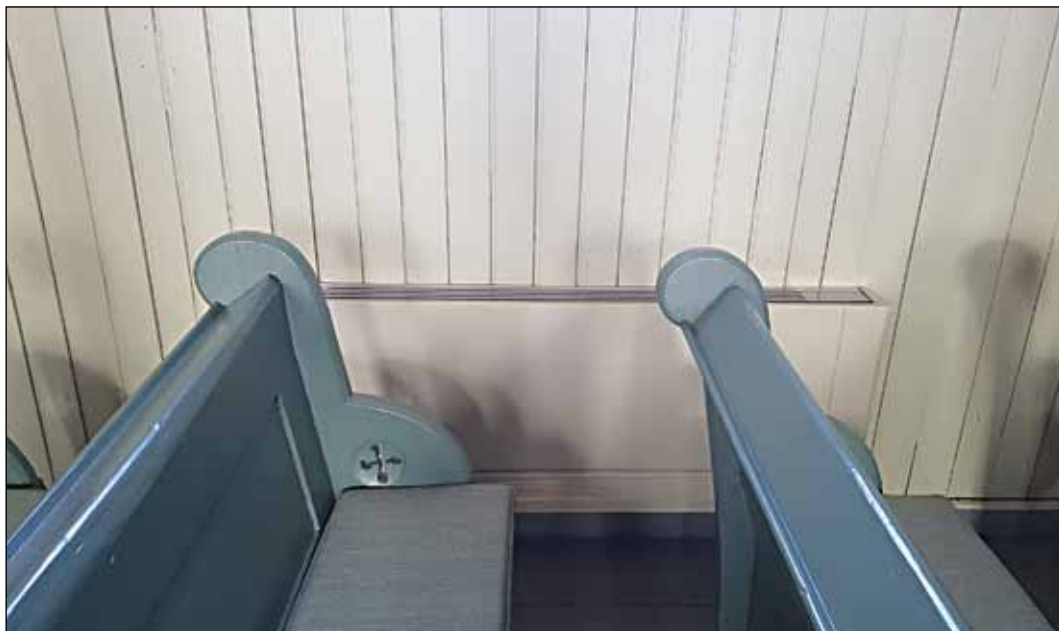
Nye radiatorer (viftekonvektorer) i Folldal kirke: Fargen og utformingen glir pent inn i det øvrige interiøret (foto: Frode Solly).

I kirkestua ble det montert luft-til-luftvarmepumpe. Denne pumpa er beregnet for å takle de utfordringene vi har vinterstid her i Folldal. Den er levert med appstyring, og kan styres fra mobiltelefon. Her også vil kir-