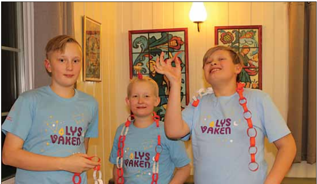
Lys våkne gutter: Tre deltakere i sving i kirkestua adventshelgen 2018 (arkivfoto).