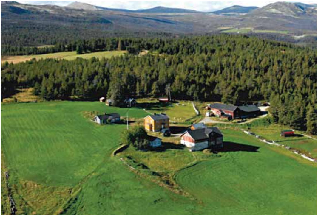
Fritt utsyn: Garden Vehllykkja.