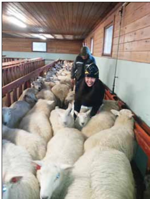
Trongt i bingen: Ein fin flokk med sauer i fjøset.

Gunnbjørn fortel at «Rusle tusle» var på ein tur ein fin onsdagskveld i juli. Det var 16 personar som gjekk frå Søre Ståland og opp til Ole Brumm-huset, med niste og kaffe og kos i det flotte vèret.