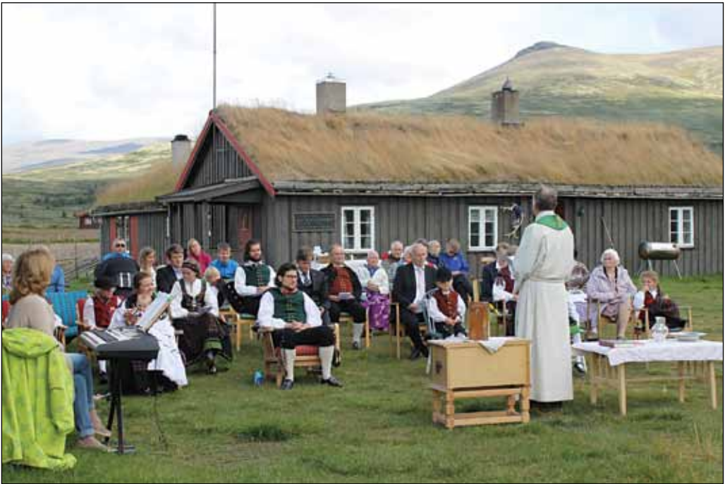
Fritt på fjellet. Fra setermessa på Meløya 8. august