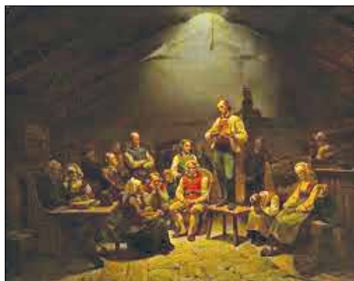
Haugianerne av A. Tidemand

Berge Furre besøkte hans hjemsted, der Hauge fikk motet og kallet til sin tjeneste, og skal ha uttrykt: «Her begynte det moderne Norge.»