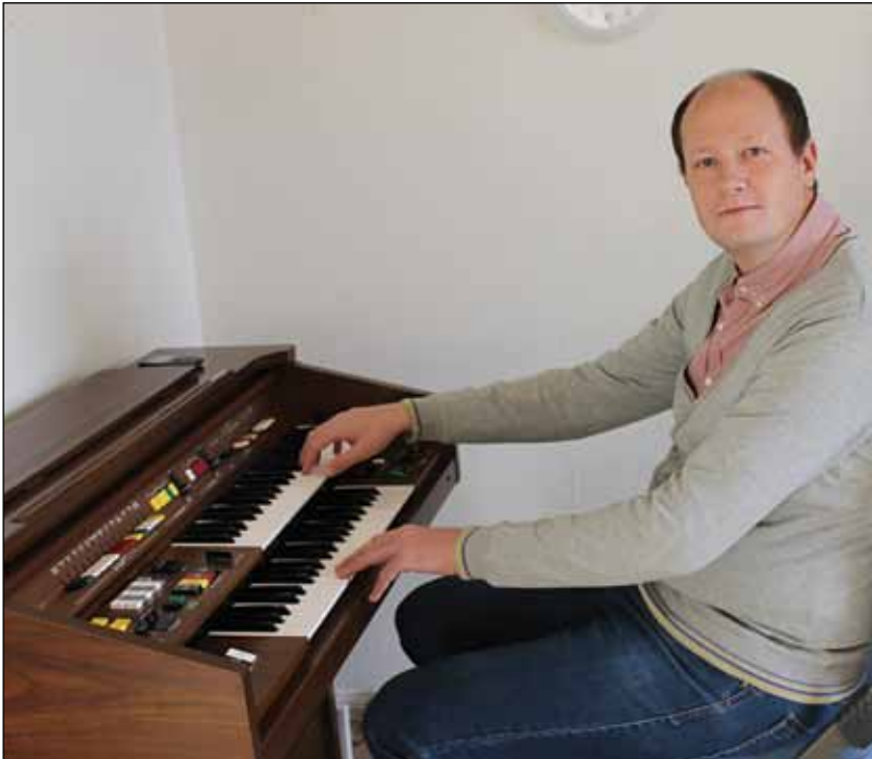
Øvingsinstrument: Vår nye organist har et el-orgel til å øve på hjemme.