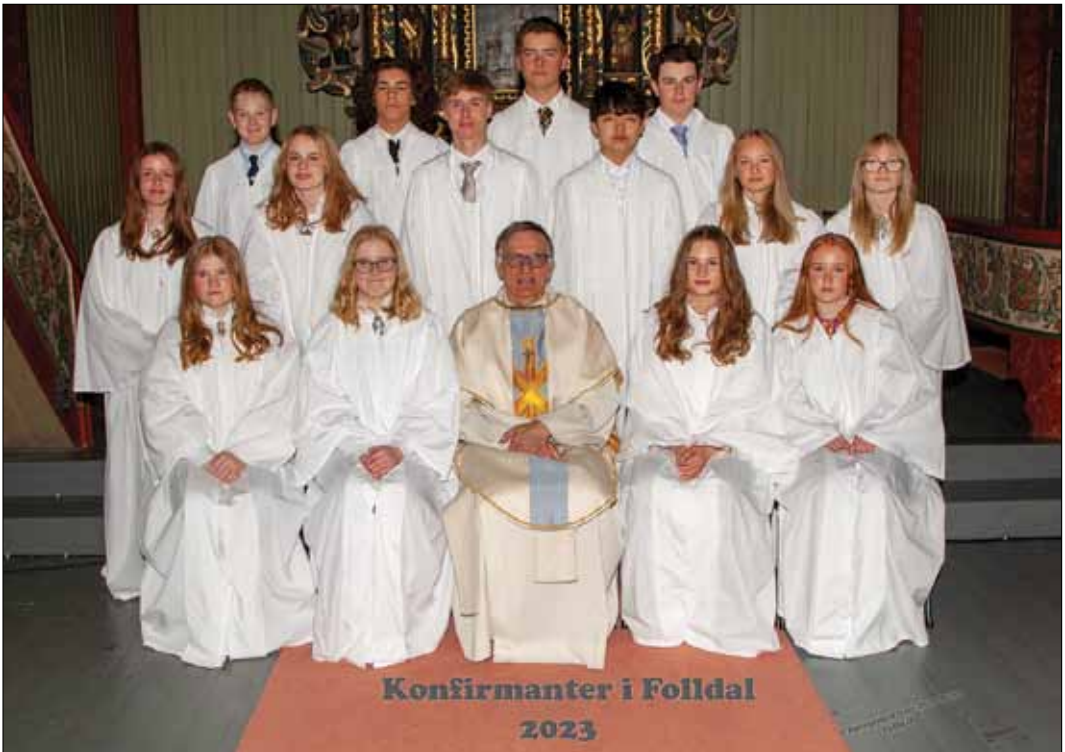
Konfirmanter i Folldal 2023