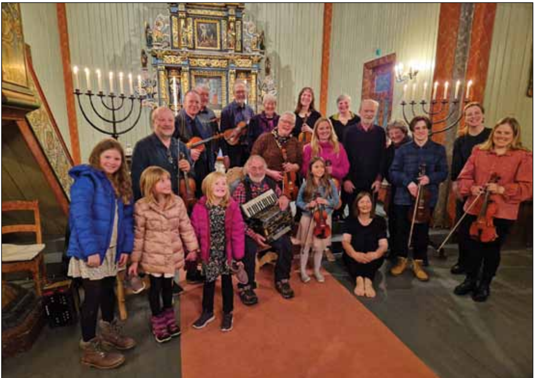
Folkemusikk: Flinke sangere og musikere deltok på flott konsert i Follidal kirke i onsdag før skjærtorsdag.