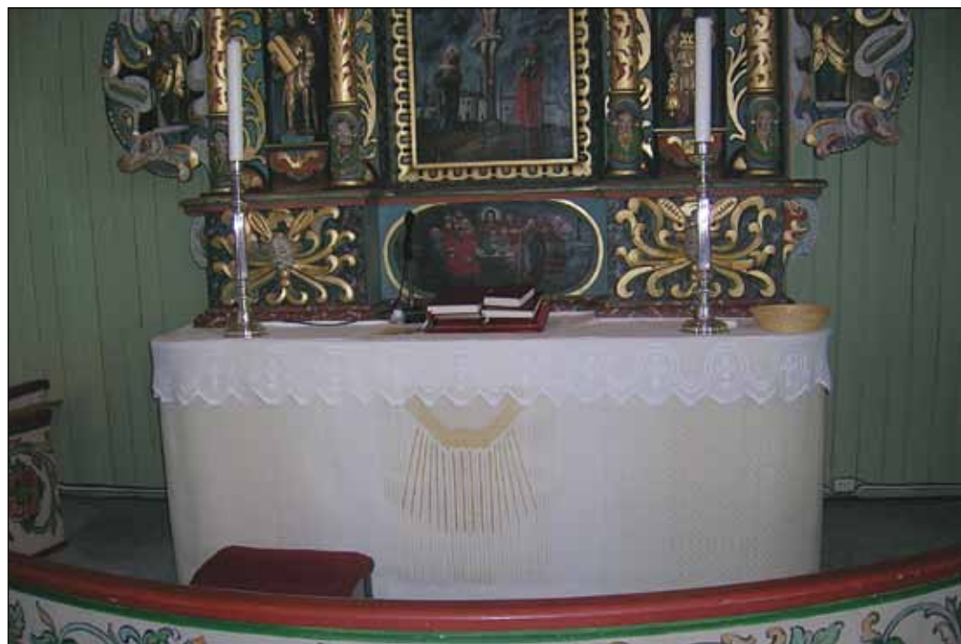
Kirketekstil: Hvitt antependium i Folldal kirke, vevd av Møyfrid Brendryen (arkivfoto).

Det blir salg av kake, kaffe og orgelbrus i kirkestua.