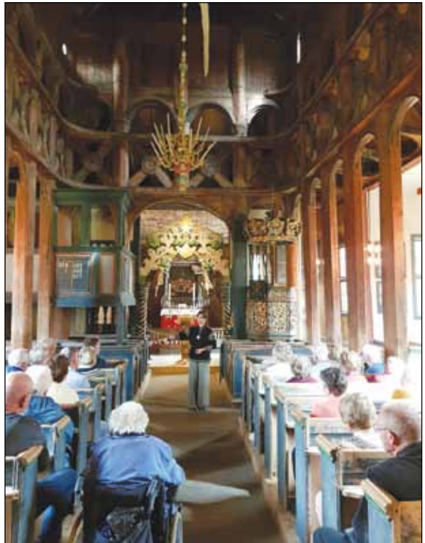
Folldølar i Lomskyrkja. Eit lite glimt frå årets diakonitur til Lom på, her frå den rikt utsmykka stavkyrkja.