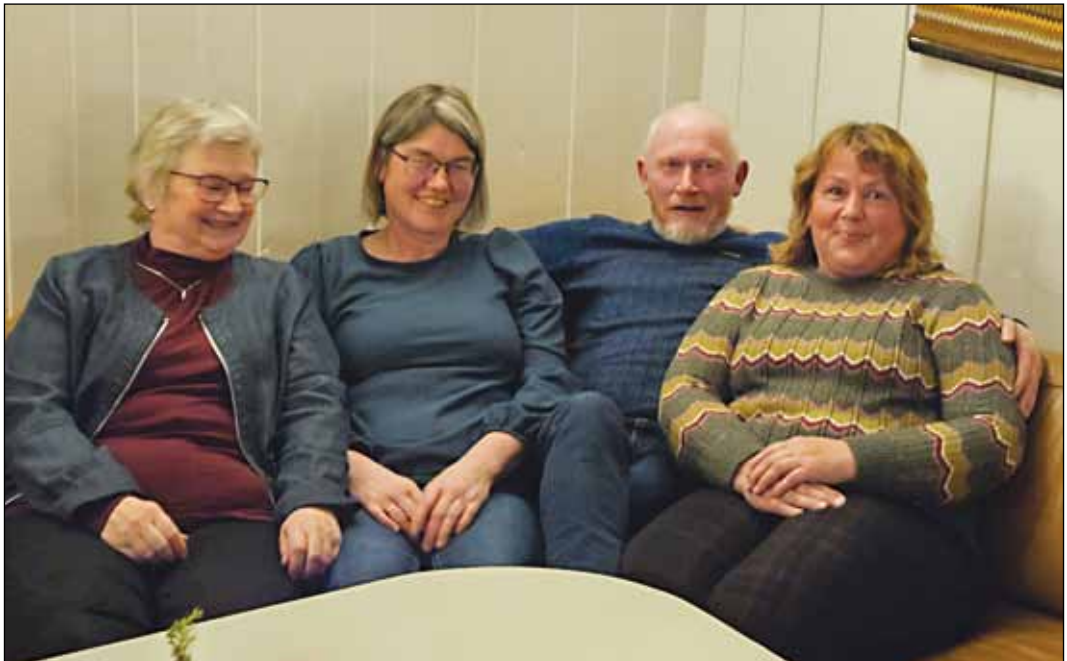
Trivsel i sofaen: Øvre Folldal sokneråd