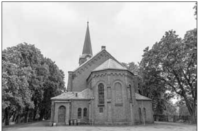
Sofienberg kirke.

«Stille Nacht» er nå blitt sunget verden over i snart 205 år. Sangen er blitt oversatt til 140 språk og er blitt spilt inn hundrevis av ganger gjennom årene. Bing Crosbys innspilling fra 1945 er den tredje mest solgte singelen gjennom tidene!!!