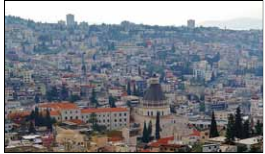
Nasaret, med Bebudelseskirken i forgrunnen.

I hele min levetid – og lenge før det – har det vært krig et eller annet sted i verden. Vi får inntrykk og bilder direktesendt på alle medier døgnet rundt. Noen mener vi blir likegyldige til slutt, men jeg tror ikke det. Jeg tror at barn påvirkes og blir redde av bildene fra Gaza slik jeg ble for seksti år siden. Og når det gjelder oss voksne, så vet jeg at det er flere enn meg og han i godstolen ved siden