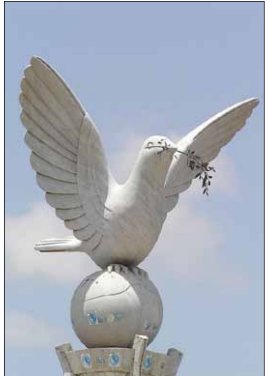
Fredsdue. Lomé, Togo i Afrika.

I kirkene leser vi hvert år på julaften om fredsyrsten fra Betlehem. I samme bok i Bibelen, hos profeten Mika, står det også at folk en gang skal smi sine sverd om til plogskjær og gjøre om spydene til vingårdskniver. For en visjon! Tenk om vi i stedet for å produsere