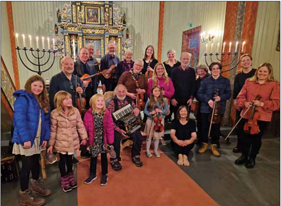
(Arkivfoto: Spellmannslaget med gjester, april 2023).

for eksempel Overmåte fulle av nåde (folketone fra Oppdal). Et av de liturgiske leddene er hentet fra Ukraina. Inngangsmarsjen kommer også til å bli feiende flott! Velkommen!