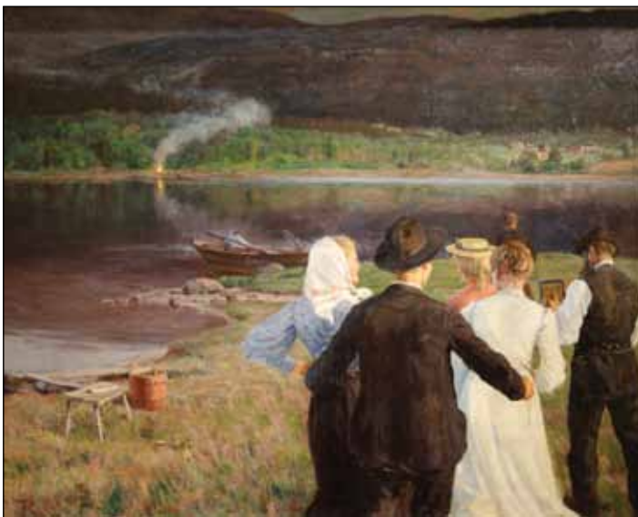
Sankthansfeiring: Folk på bygdene har ofte samla seg rundt eit bål sankthanseftan. Måleri av Gudmund Stenersen.