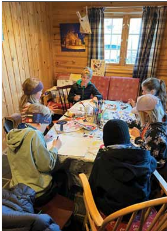
Hobbyaktivitet: Full konsentrasjon i kyrkjestugu.

I slutten av april var elever frå 3. og 4. klasse samla i Dalen kyrkje til song, leik og læring.