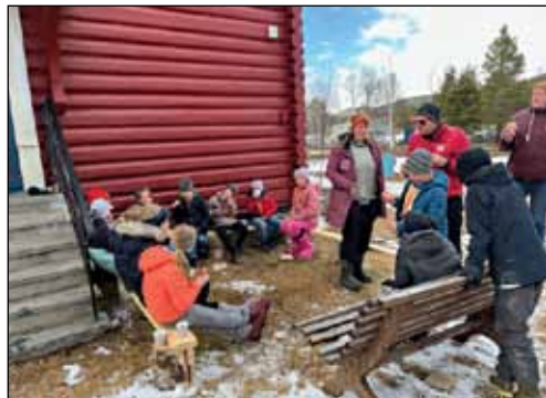
Matpause: Godt med noe varmt i livet i kaldvinden.