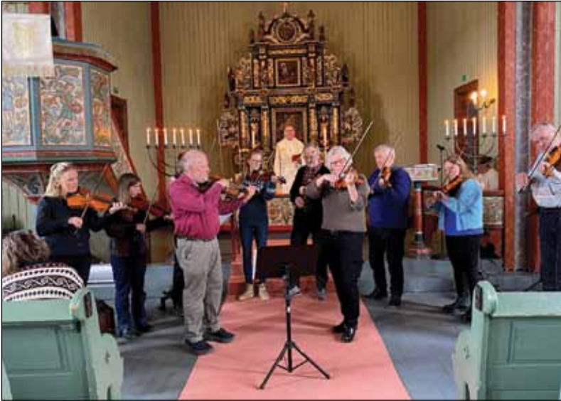
Fylte rommet: Musikken fra spellmannslaget fylte det store kyrkjerommet og gav ekstra høgtid.

April var ein aktiv månad i kyrkjene våre. Da var det også folkemusikkmesse i hovudkyrkja. Spellmannslaget hadde øvingshelg, og dei spelte også i Vårtun kvelden før. Under messa var det høgtideleg inngangsprosesjon med alle musikanane. I tillegg spelte dei til salmane og framførte solonummer.