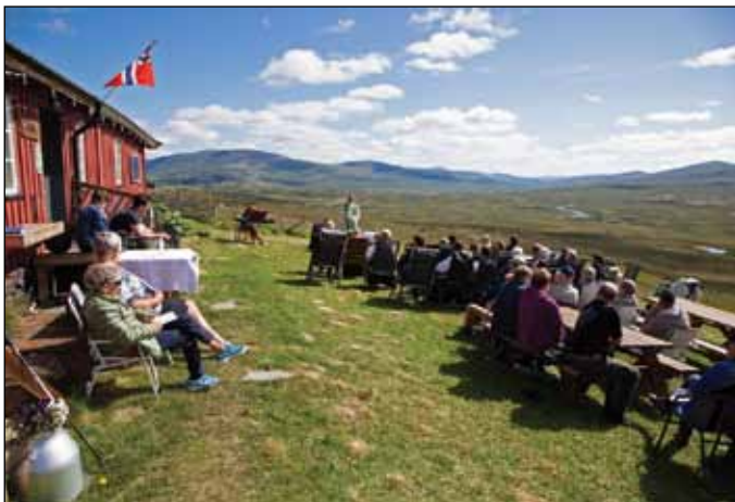
Setermesse, Døllia 2020.

22. sept. 18. søn. i treenighetstiden Matt 8,5-13 kl. 11.00 Dalen kyrkje. Høsttakkefest, med utdeling av 6-årsbok og presentasjon av nye konfirmanter. Kirkekaffe. kl. 19.00 Folldal kirke. Høsttakkefest, med presentasjon av nye konfirmanter. Kirkekaffe.