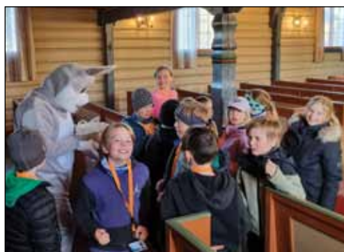
Kven kjem her? Påskeharen dukka opp med litt godteri til blide ungar!