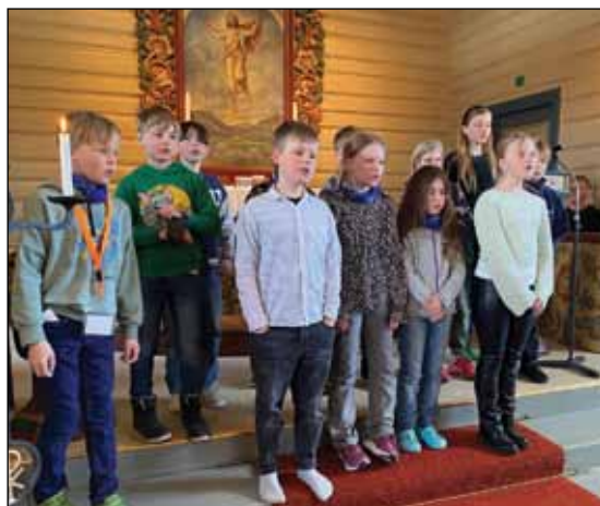
Unge songstrupar: På gudstenesta song tårnagentane På Golgata stod det et kors og Påskemorgen slukker sorgen.